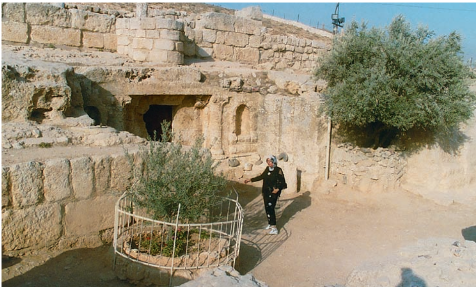
Die Umgebung der Höhle

und Denzel Fisher entdeckt. Der Eingang ist von zwei Säulen flankiert. Dort, wo die Knochen der Begrabenen gefunden wurden, gibt es eine Öffnung in der Decke, die mit drei Arkaden dekoriert ist. Nachdem ein Hund 2004 einige Knochen ausgegraben hatte, wurden diese entfernt. Rechts neben dem Höhleneingang kann man die Gräfte und die Öffnung in der Decke sehen. Gegenüber werden in einen Glasschrank die Überreste byzantinischer Gebrauchsgegenstände gezeigt. ■