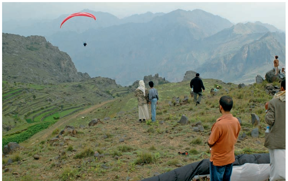
Die freundlichen Jeminiten beobachten den Flug