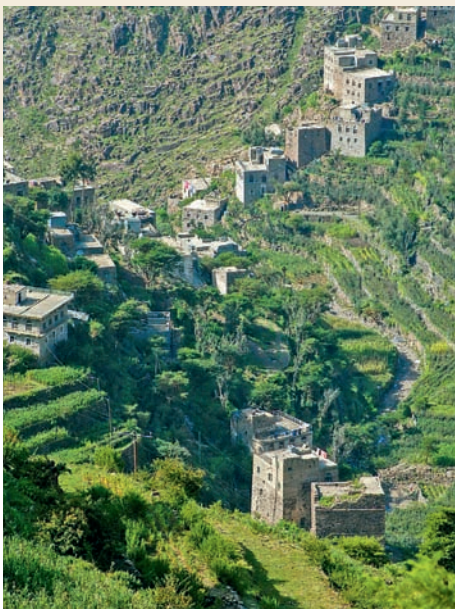
Die Stadt am Hügel

Der Jemen verfügt über herrliche Naturlandschaften und hat ein enormes Potential für alle Sparten des Abenteuer-Tourismus. Dies ist keine Übertreibung oder ein Marketingspruch, sondern es geht um tatsächliche Potentiale, die gerade erschlossen werden.