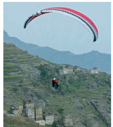
Die Freiheit des Fliegens