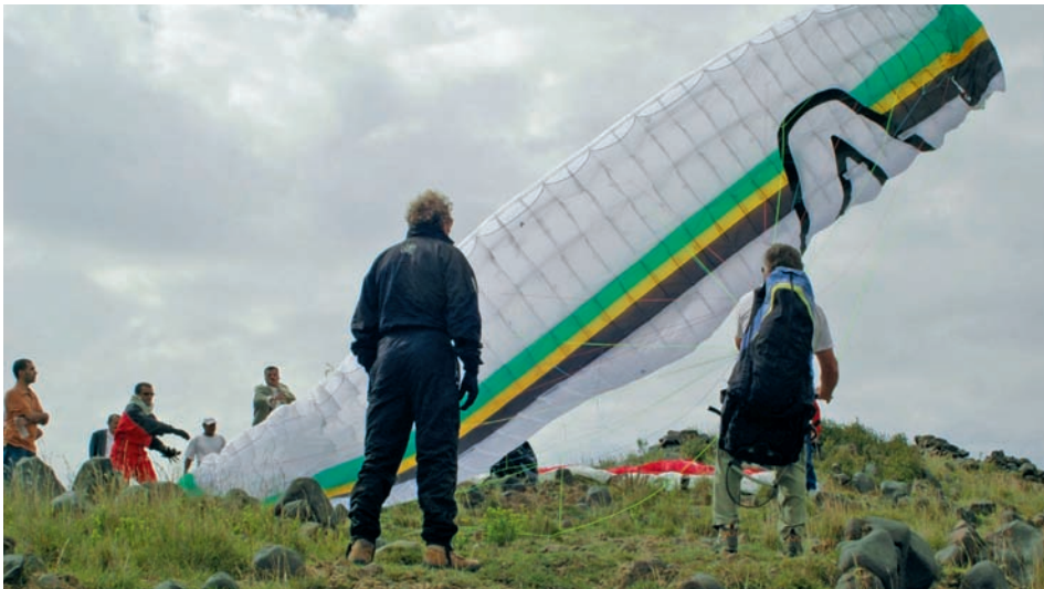
Viele helfende Hände