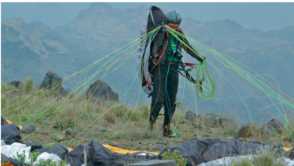
Alles ging gut