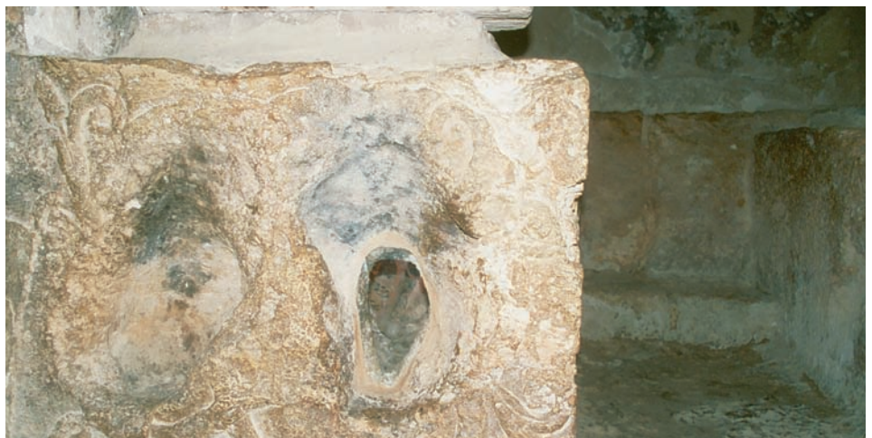
A l'intérieur de la grotte