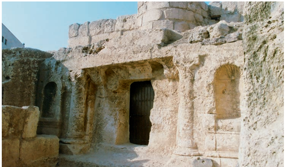
Porte de la grotte

Lorsque j'ai visité le site, j'y ai trouvé une mosquée qui a été construite au-dessus de