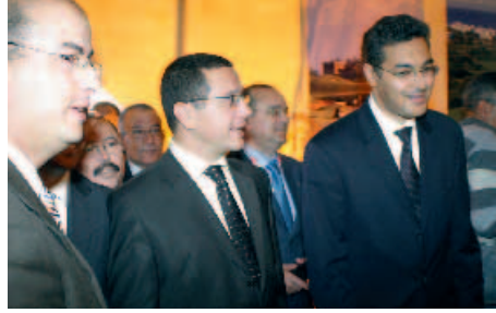
وزير السياحة المغربي ومدير المكتب الوطني للسياحة المغربية