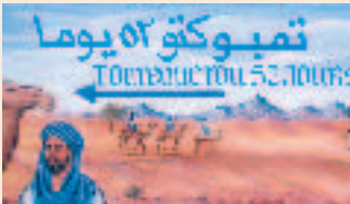
Indication routière علامة على الطريق

Tous les déserts ne se ressemblent pas. Souvent, les touristes sont déçus lorsqu'ils découvrent que le désert (marocain) est formé essentiellement de roches et de pierres grandes et petites. A l'extrême sud marocain, on trouve un splendide ensemble doré formé d'une mer infinie de sable. C'est le Sahara, tel qu'il est connu par son mystère et à travers les films. Mais, encore une fois, son observation de visu est totalement différente et dépasse le temps et l'espace. Les dunes de sable donnent l'impression de la vaste étendue étouffant tout bruit.