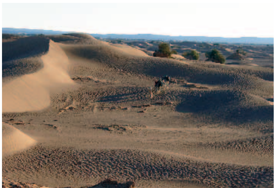
Petite caravane traditionnelle