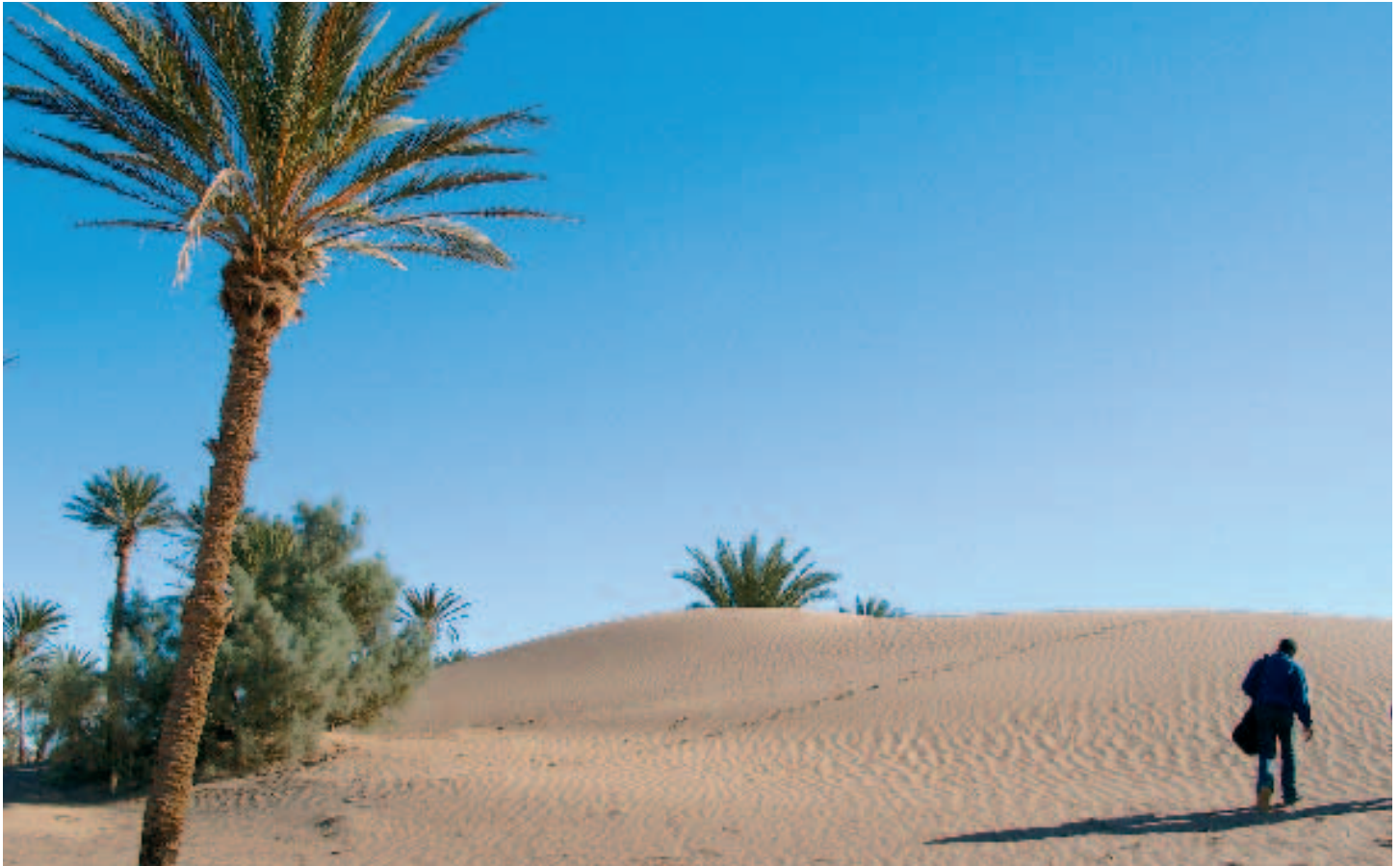
Au départ de Mhamid