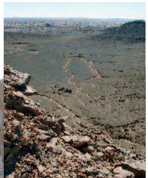
Ruines d'une ville antique en montagne بقايا مدينة قديمة على جبل