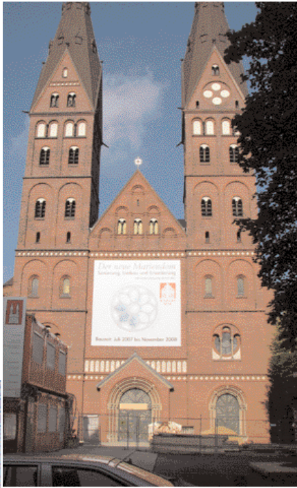
The Catholics Cathedral كاتدرائية الكاثوليك

إذا كانت لديكم فرصة لزيارة سوق السمك سانت باولي كل يوم أحد من الساعة 7 إلى 10 (في الشتاء) ستتمكنون من التمتع بالعديد من المسرات.