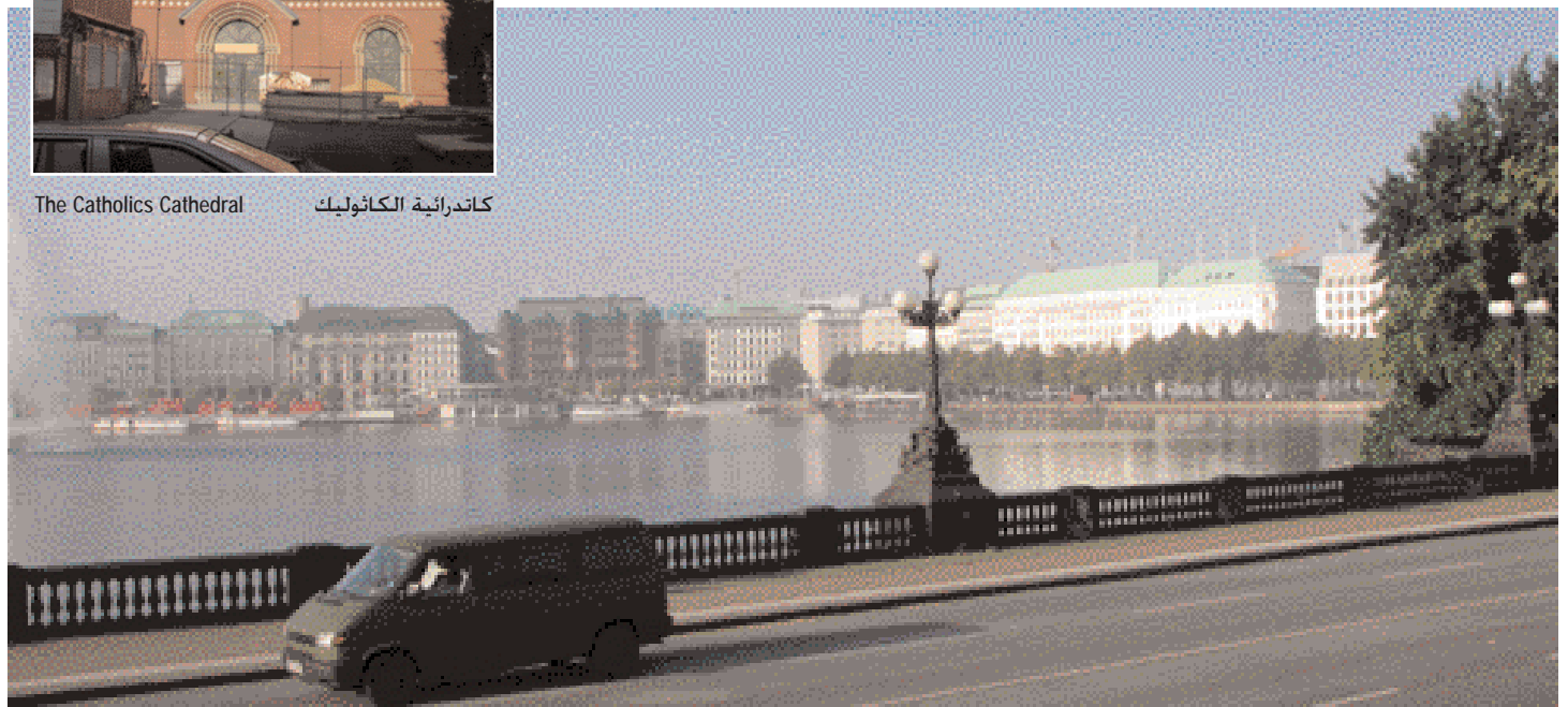
View of the city with the Alster Lake

إن الإمكانات الثقافية والتسوق في هامبورغ لا ينبغي تجاهلها. وحياة الترف يمكن رؤيتها في يونغفيرنشتايغ. وفي الجانب الشمالي الشرقي من وسط المدينة، ستجد القنوات التي تربط