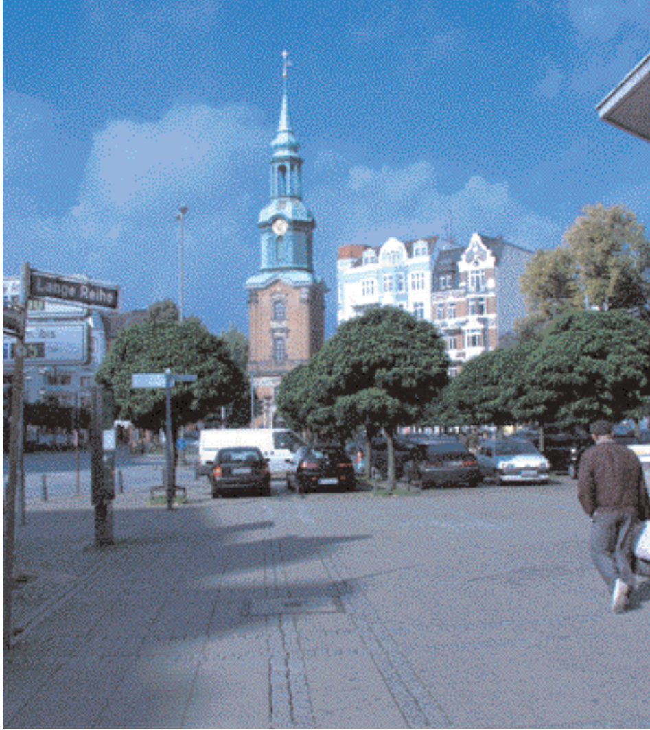
The church of St. Georg names the quarter

الأولى في داخل البيوت الجانبية البعيدة عن الشوارع الرئيسية.