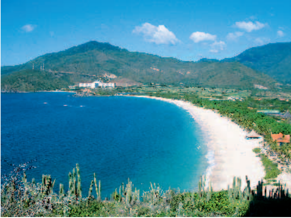
Playa en la isla Margarita

الرحلات المذهلة في تنوعها. ومن أهمها ما يلي: شلالات أنجيل، وذلك لمشاهدة أعلى شلالات في العالم؛ كاراكاس، للتسوق والمزارات؛ جزيرة مارغريتا، للسوق الحرة والطواف في الجزيرة؛ وجولات لمزارع البن ومزارع أخرى. ومن ناحية أخرى، إذا كان المرء مهتماً بالتاريخ فإن رحلة إلى برشلونة القريبة، عاصمة ولاية انزاتيكوي، أمر لا بد منه. العمارة التي يحافظ عليها جيداً والتي بنيت في عهد الإستعمار، تحيط ساحة البوليفار، وميراندا وبواكا. والأخيرة هي الساحة الأصلية وقد بنيت عند إنشاء المدينة. كاتدرائية كارمن، ومتحف انزاتيكوي، وهو أقدم مبنى في المدينة، وكذلك أيضاً كاسا فويرتي (البيت القوي)، وهو صرح وطني تاريخي بني في بداية القرن السابع عشر. تستحق التوقف عندها. استكشاف هذه الآثار عادة ما يكون متضمناً في الجولة حول المدينة، وهو أمر مفضل لدى الكثير من الزوار. وإذا تركنا التاريخ جانباً، فإن معظم السياح الوافدين إلى بويرتو لا كروز يأتون من أجل الغوص والسماك والتزلج على المياه، والتمتع بالشواطئ، خصوصاً شواطئ موشياما. هذه المجوهرات القريبة من الرمال والمناخ المعتدل تجذب أكثر فأكثر المسافرين من الشمال وأوروبا. ◀