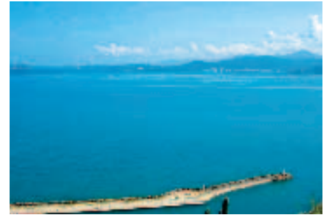
Vista de Puerto la Cruz

لمن يود تنظيم رحلاته الخاصة، توجد جميع أنواع القوارب التي تؤجر، على المرافئ والشواطئ، وبأسعار معقولة للغاية. بويرتو لا كروز هي أيضاً نقطة انطلاق إلى عدد من