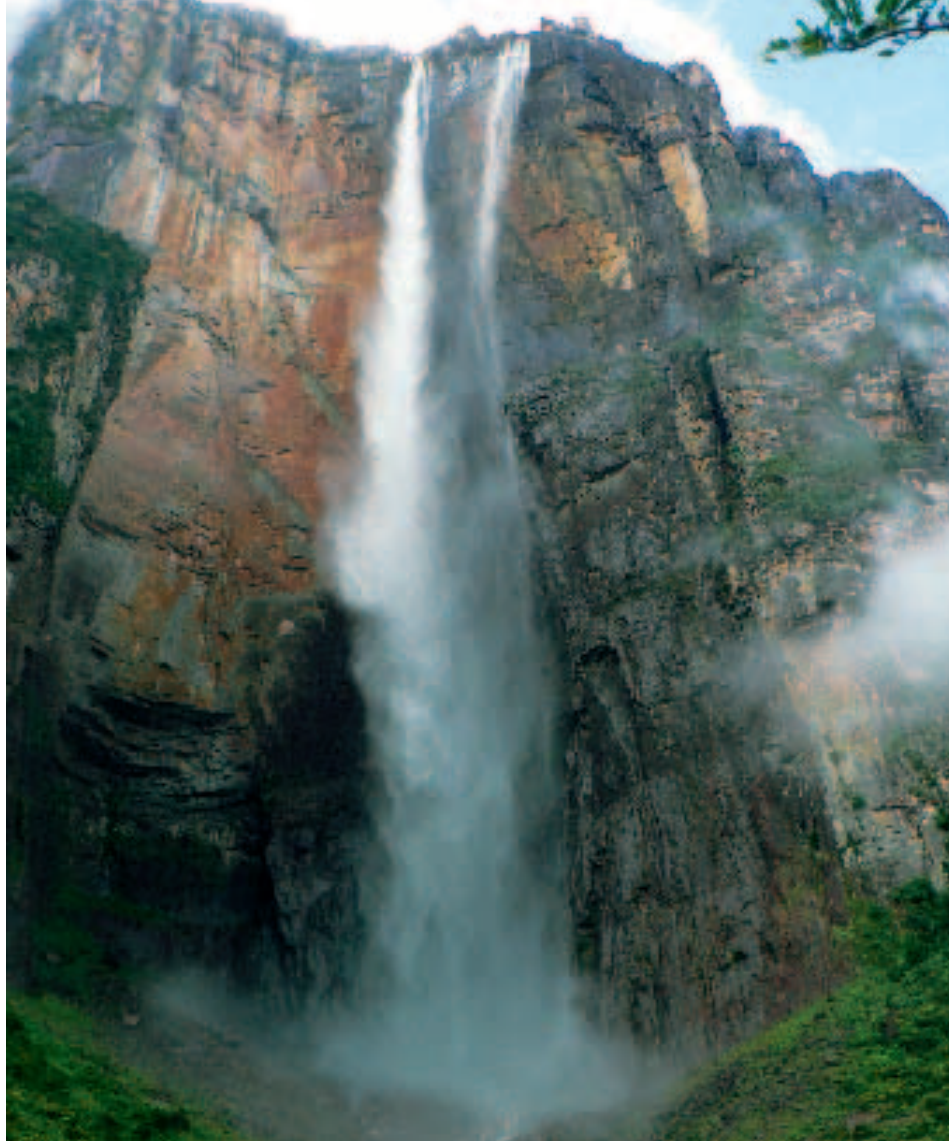
Cataratas del Ángel

إلتفت إلي صديقي الذي تعرّفت عليه حديثاً ونحن ننزل من الطائرة في مطار برشلونة، بوابة الوصول إلى بويرتو لا كروز، أحد أكبر المنتجعات في فنزويلا. "أنا لا أصدق! في ساعات قليلة، الخضرة والحرارة حلا محل البرد والثلوج". لم أكن مصغياً، فقد كنت منتشياً بنسيم منتصف النهار، ولكن كنت في داخلي أشعر بالقلق بعض الشيء. "أتمنى لو كنت على الشاطئ، ففي الوقت الذي نخرج فيه من المطار ونصل إلى الغرف، سيكون النهار قد انقضى". كنت أفكر بمطارات وفنادق أخرى يضيع فيها الكثير من الوقت في الشكليات البيروقراطية.