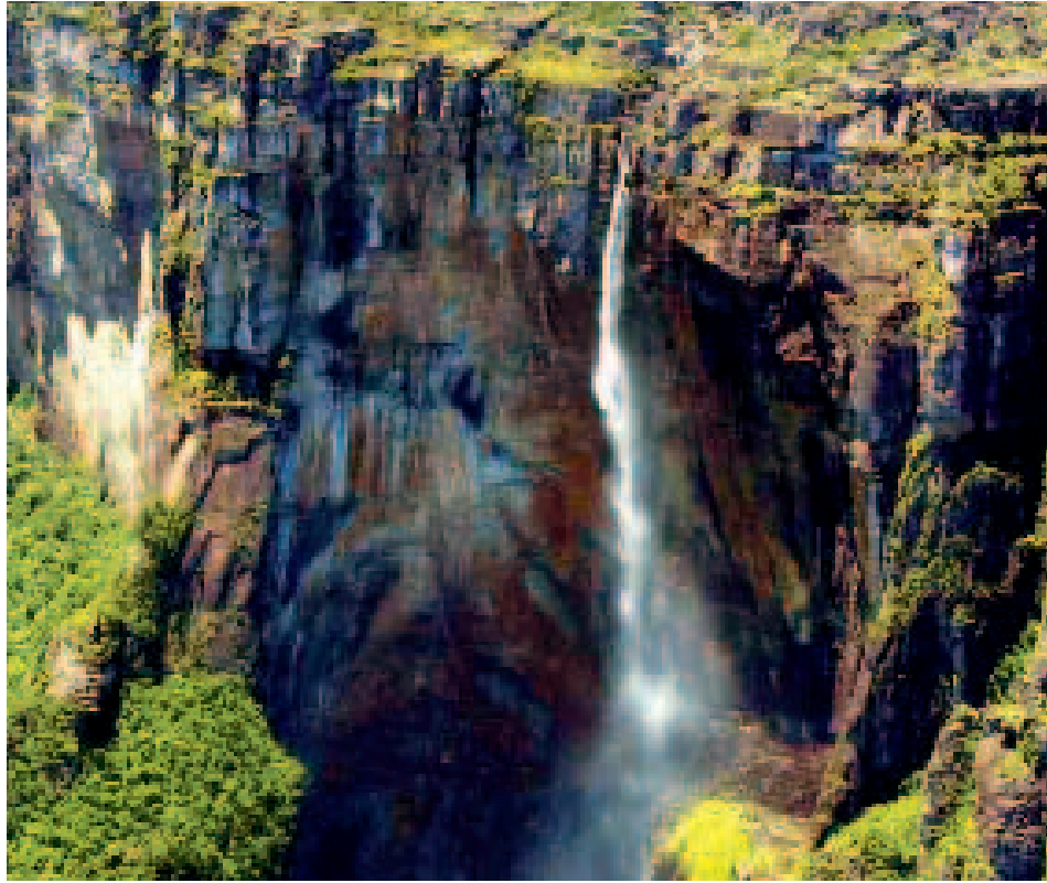
Cataratas del Ángel