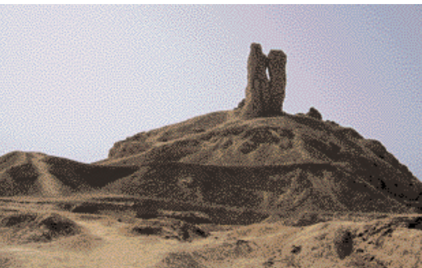
Die Überreste vom Nimrod Palast und dem Turm von Babel

Die heilige Stätte und ihre Umgebung sollte besser gepflegt und mehr beachtet werden. Der bedeutsame heilige Ort ist schließlich der Geburtsort des Stammvaters der Propheten, Abraham. Die Zikkurat und die Überreste der brennenden Grube sind von großer historischer Bedeutung. ■