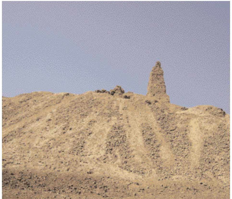
Blick auf den Nimrod-Palast heute

Auf der Gebäudespitze thront eine 20 Meter hohe Kuppel, die mit Kashani-Ziegeln aus Kerbela gedeckt ist. Die grünen Kacheln sind ▶