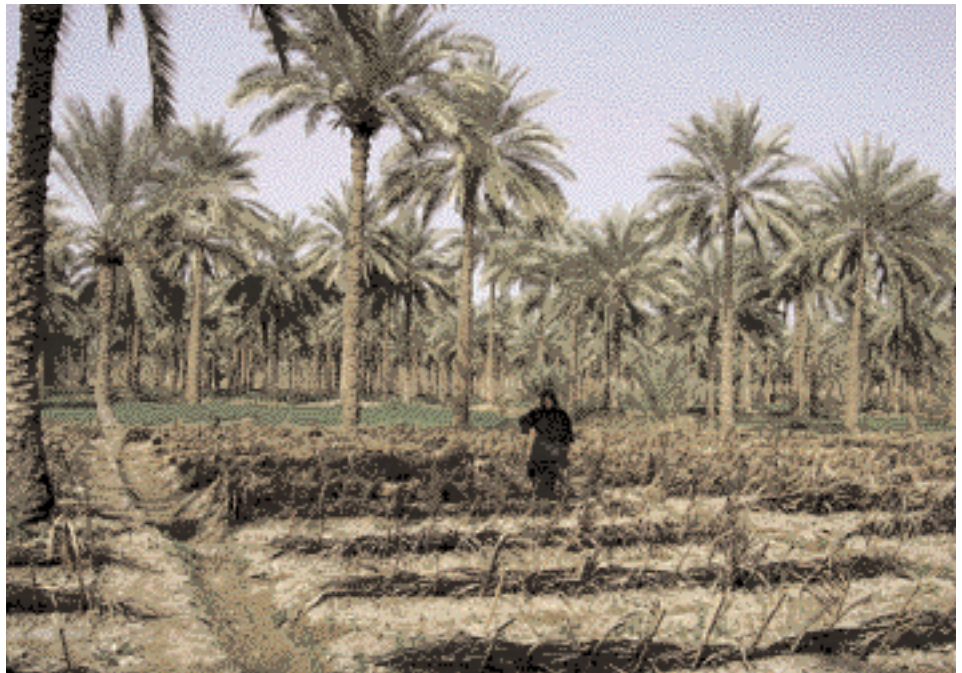
Oase in der Nähe der Feuerstelle

Ohne Reiseführer ist es nur schwer möglich, die ehemalige Stelle des Scheiterhaufens zu finden, die auch vielen Einheimischen unbekannt ist. Wir fanden sie schließlich an einer holprigen Straße, von Hecken bedeckt und von Schlammflöchern umgeben. Die seinerzeit riesige Grube war von den Bewohnern des ganzen Königreiches mit