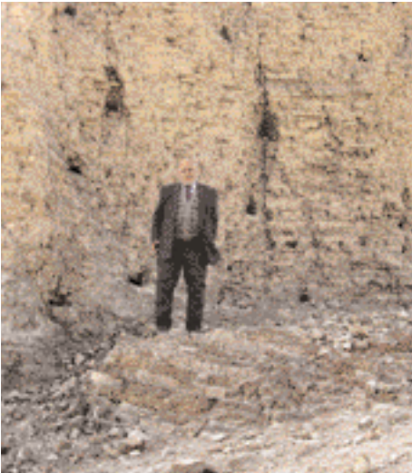
Der Autor am Nimrod-Palast الكاتب في قصر النمرود

dem so genannten 'Abrahams Hügel', befindet sich ein Schrein, den man über die Felder erreichen kann.