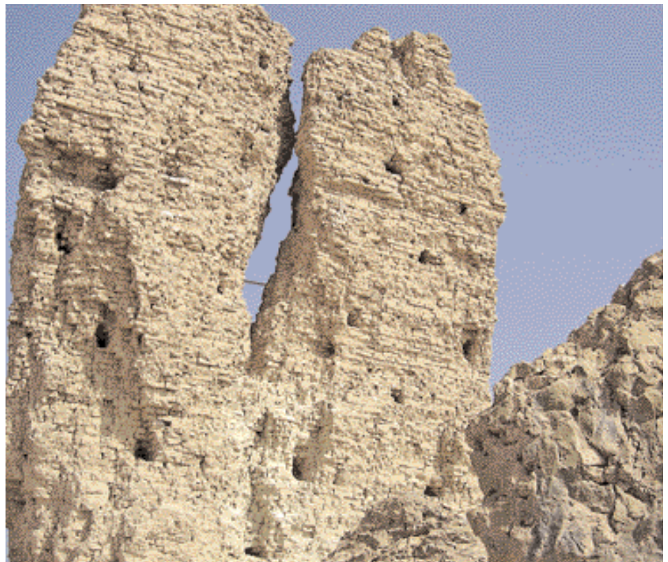
Mysteriöse Löcher in den Turmruinen des Nimrod-Palastes