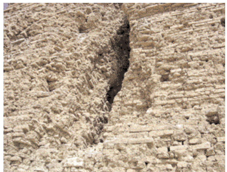
Nahansicht des Turmes