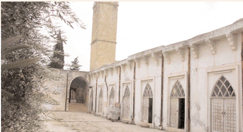
La grande mosquée à Sarmin

«Idlib est un coin du paradis, et une forêt dense». C'est ainsi que les voyageurs français ont décrit cette province située au nord-ouest de la Syrie, délimitée au nord par la Turquie, à l'est par Alep, au sud par Hama et à l'ouest par Lattaquié. Avec une superficie de 610 000 ha et 1 750 000 habitants, elle est la porte arabe de l'Anatolie et de l'Europe, et un important carrefour de communication et de civilisation. D'où sa richesse en patrimoine historique, avec 650 sites historiques, soit le tiers du patrimoine syrien.