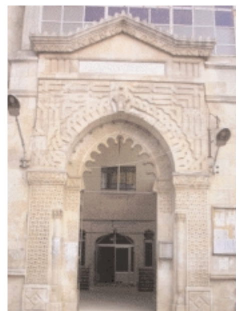
Entrée de la mosquée Takharim

Idlib la verte adresse une invitation permanente palpitante d'amour pour tout visiteur à la recherche de quiétude et de plaisir. ■