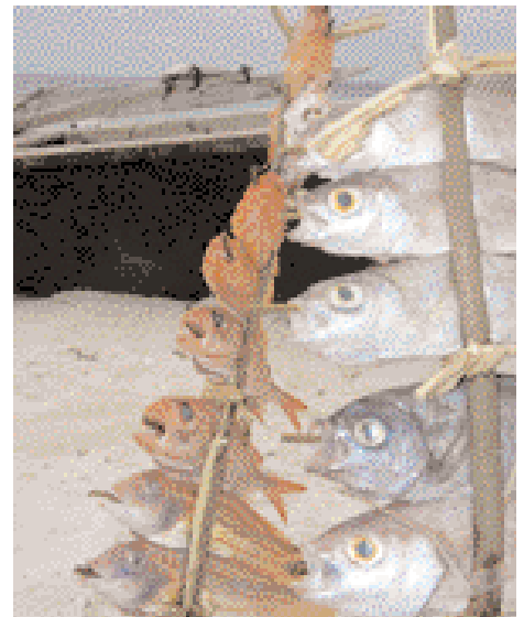
Plats populaire de poisson الأسماك غذاء شعبي

Développer des stratégies efficaces pour la protection environnementale est devenu impératif pour mettre un terme à la dégradation de l'environnement aujourd'hui. On reconnaît de plus en plus que le changement durable dépend de la participation à long terme et de l'association des communautés à la protection environnementale. L'utilisation de la croyance islamique dans la protection de l'île de Misali est un exemple fascinant de la façon dont les principes moraux inhérents à l'Islam peuvent être employés pour faire de meilleurs choix dans le traitement de l'environnement de notre planète et pour le bien-être de toute l'humanité. ■