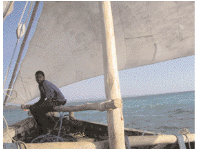
Dhow près de l'île Misali