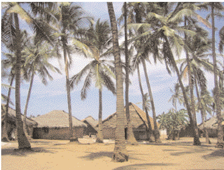
Village de Pembam

réglementée et les méthodes destructives telles que la dynamite, le poison, et les filets finement engrenés ont dévasté les populations halieutiques et l'environnement sensible de récif qui les soutient. Le gouvernement a établi un secteur officiel de conservation en 1998, mais les règlements conventionnels ont eu peu