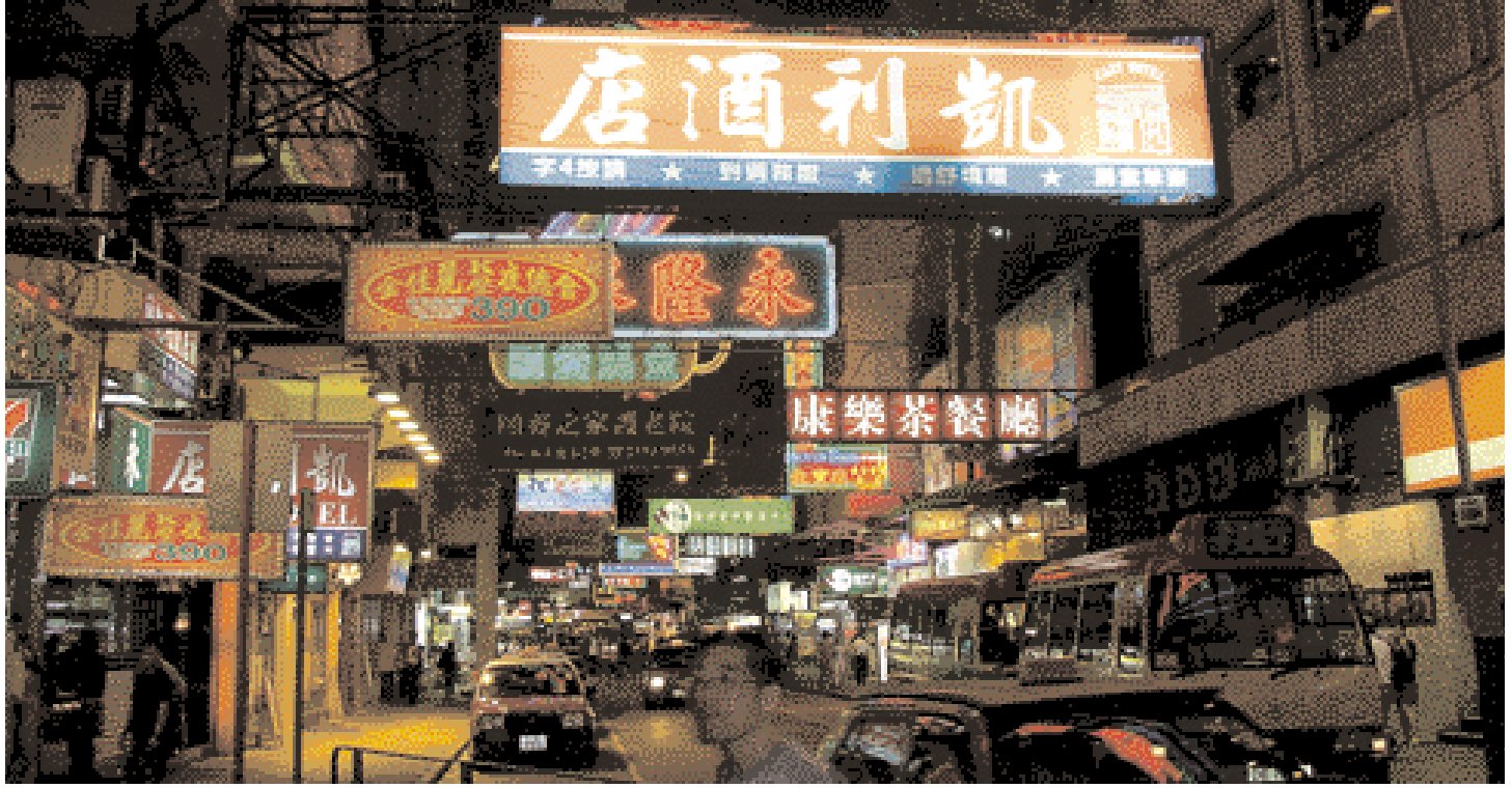
The more Chinese Kowloon by Night