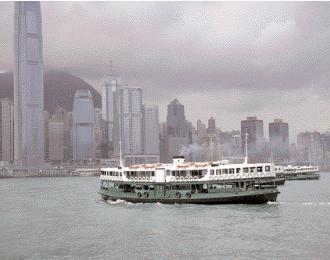
The old Star ferries are romantic pure

إذا كان السياح يبحثون عن نماذج نمطية من العمارة الصيني والأسواق والمعابد، فإن هونغ كونغ ليست المكان المناسب لمثل هذه الزيارة. هونغ كونغ تقدم مزيجا من التراث الاستعماري البريطاني والمدن الصينية العالمية لعصر ما بعد الحداثة. لأكثر من 100 عام وعبارة ستار فيري تنقل البحريين ما بين كولون ومدينة هونغ كونغ، وتقدم منظرا رائعا لميناء فيكتوريا وأفق المدينة. منظر آخر مذهل يرى من قمة فيكتوريا في أعلى جبل في الجزيرة (552 م) والتي يمكن الوصول إليها إما عن طريق الترام القديم أو سيرا على الأقدام. منذ عام 1888 والترام يأخذ الآلاف من السكان والسياح إلى شان تينغ (اسم هذه القمة في اللغة الكانتونية الصينية). وحتى عام 1945، كان السكن في الجبل حصرا على البريطانيين وغيرهم من المواطنين الأوروبيين. وأما السكان الصينيين المحليين وغيرهم من الآسيويين فلم يسمح لهم بالإقامة هناك. ووسيلة النقل الشعبية الأخرى هي خط الترام القديم الذي يمتد على طول واجهة الماء في الجزيرة.