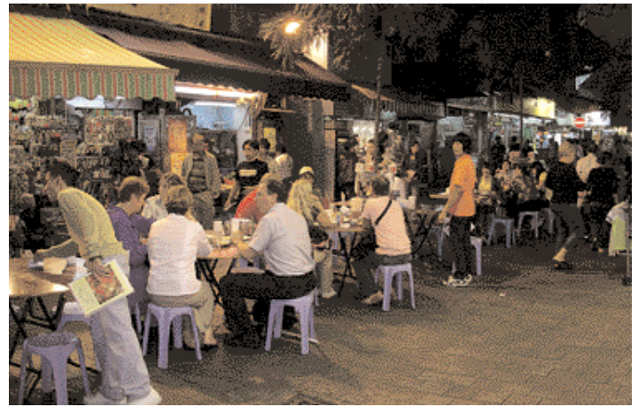
Simple food outlets on the Streets