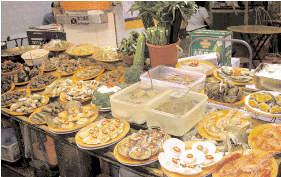
Fresh Seefood is everywhere