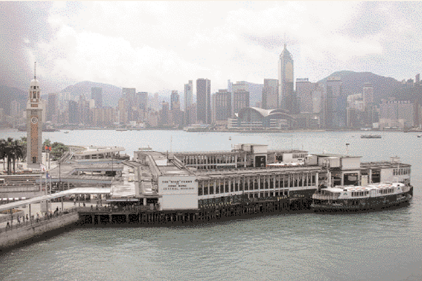
The Star Ferry Terminal in Kowloon

يعرف العالم الكثير من المدن الصينية في أمريكا الشمالية وأوروبا، حيث تتواجد المطاعم والمحال التجارية والمؤسسات الثقافية. المدن الصينية في سان فرانسيسكو ونيويورك ولندن هي معالم سياحية مشهورة.