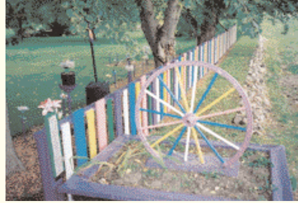
Big Valley, die Stadt der Dampfzüge

Big Valley ist die Stadt der Dampfzüge. Das Canadian Northern Railway standard second-class depot aus dem Jahr 1912 ist die Hauptattraktion. Die Big Valley Historical Society hat einen traditionellen Getreidesilo aus Holz restauriert, der den Bahnhof mit dem Vorplatz und dem Lokomotivschuppen ergänzt. Im nahe gelegenen Einkaufszentrum wird köstliche Hausmannskost angeboten. Ein Tag mit Pat macht hungrig. Neben den vielen Cafés und Restaurants in Drumheller ist das Café Italiano, der Whistling Kettle, das House of Chan und Yavis Family Restaurant zu empfehlen. Bevor man sich von den Badlands und den Dinosauriern verabschiedet, sollte man unbedingt die Kunstgalerie der Canadian Badlands Artist Association besuchen. Einige der reizenden