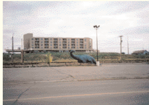
Drumheller, Hauptstadt der Dinosaurier