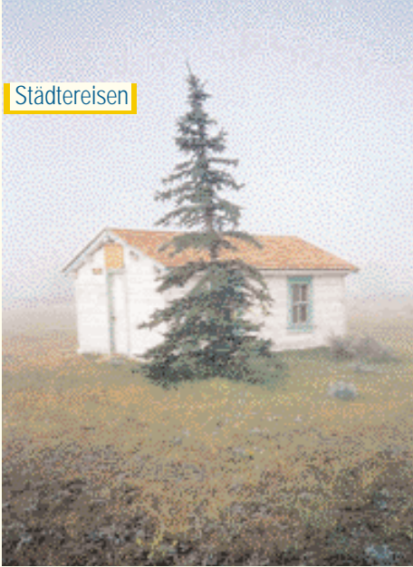
Ein Haus, eine 'Stadt': Dorothy دوروثي: نموذج مدينة البيت الواحد