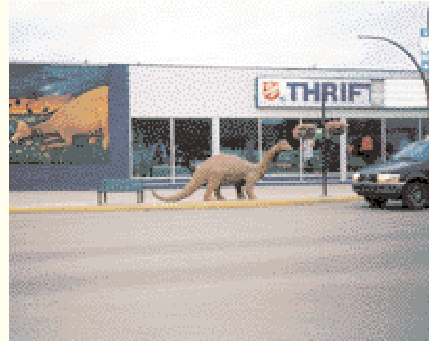
Drumheller, Hauptstadt der Dinosaurier

Auf vielen Landkarten erscheinen die Badlands als eine Region von wundersamen kleinen Städtchen wie Rose Lynn, Sherness, Dorothy und Sunnynook. Die Realität vor Ort sieht anders aus: Alles, woraus Rose Lynn heute besteht, ist ein verlassenes Bauernhaus mit einer Scheune. Das Schild an der Tür trägt die trügerische Aufschrift 'Büro', aber sonst ist kein Lebenszeichen zu vernehmen. Auch Dorothy und Sherness sind typische Beispiele für diese ehemalige Städte in denen heute eigentlich niemand mehr lebt und die nur noch aus ein oder ➤