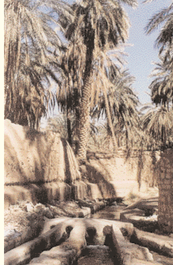
Wasserstraßen und أهد الجداول المائية والنخيل Dattelpalmen in Sidi بمنطقة سيدي مسعود Massoud

Der algerische Tourismusminister, Nouredine Mousa, begleitete seine Gäste, um das Fest zu eröffnen. Er stellte das touristische Dorf vor, in dem auf einem