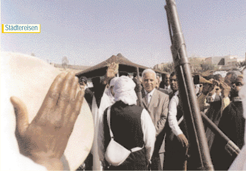
Tourismusminister Nouredinne Mousa eröffnet das Tourismusdorf

الوزير نور الدين موسى يفتتح القرية السياحية