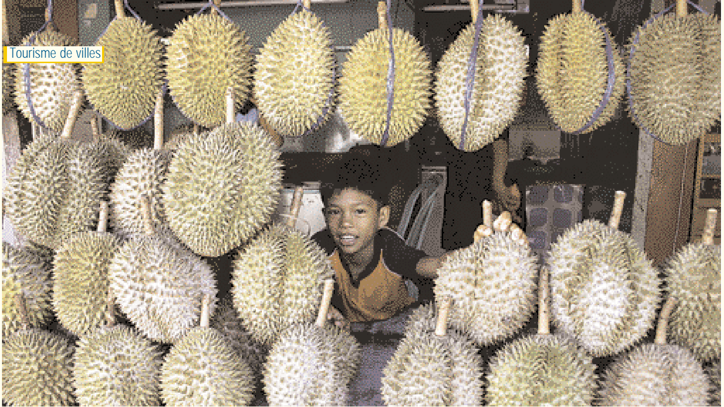
Garçon à côté d'un stand de fruits