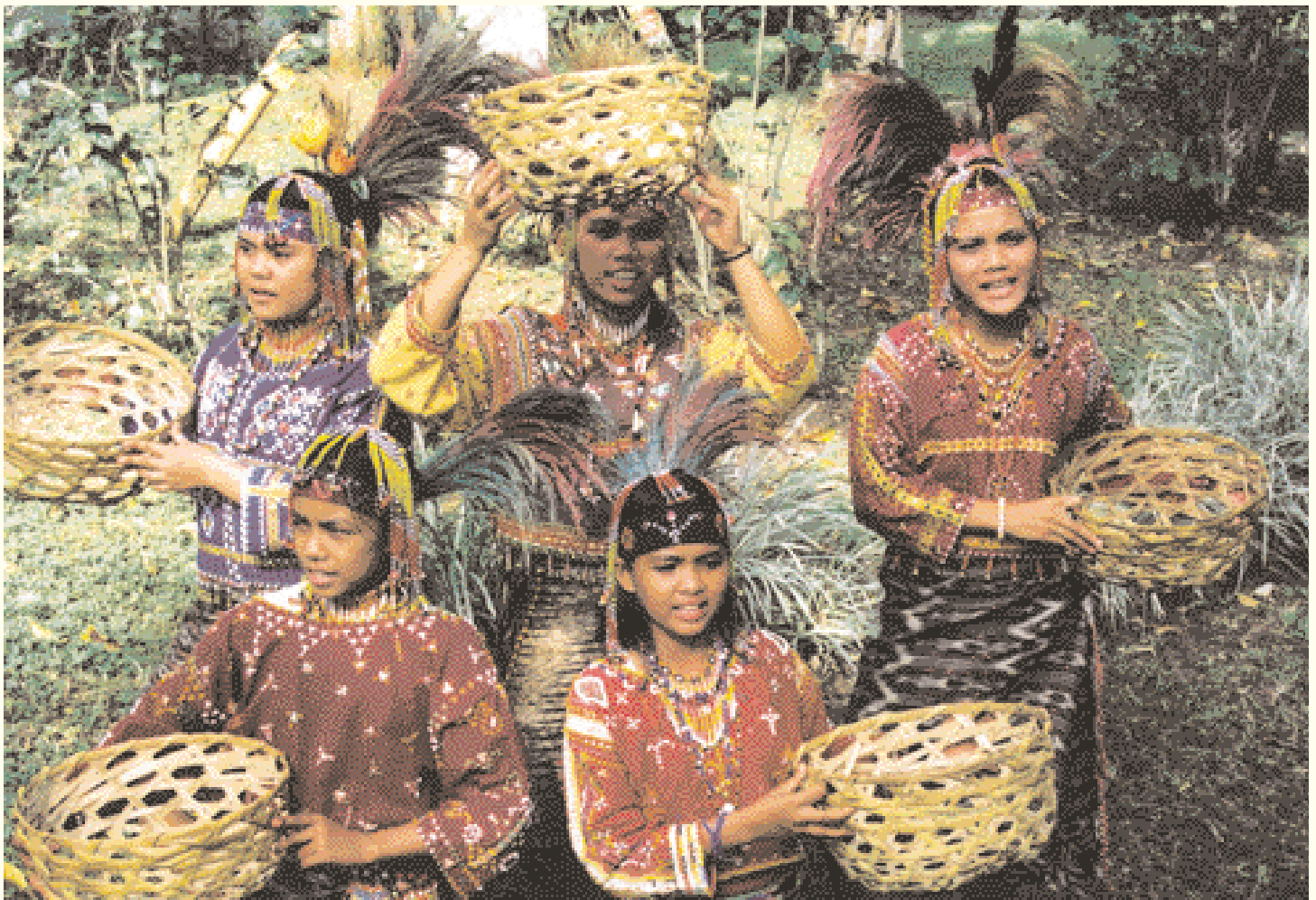
Jeunes filles portant des paniers