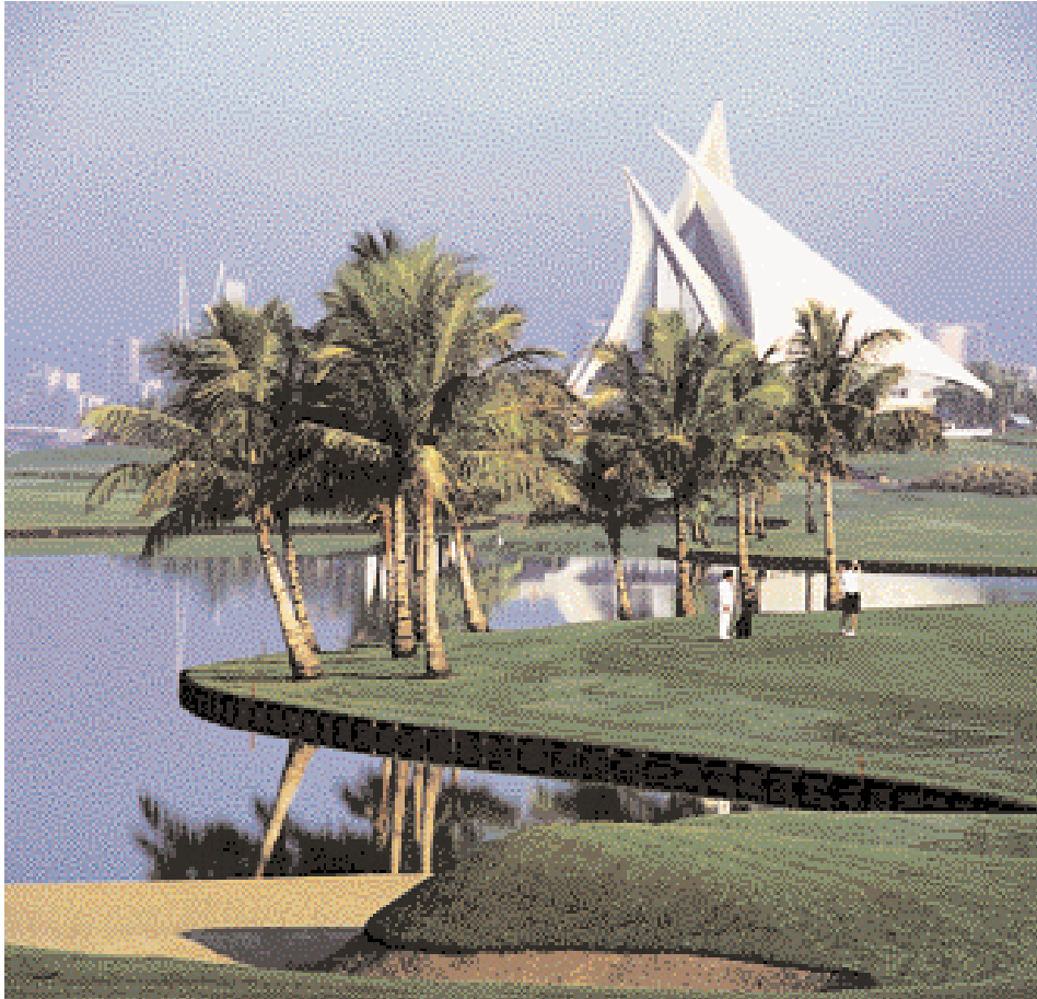
Dubai Creek Golf and Yacht Club-Clubhouse