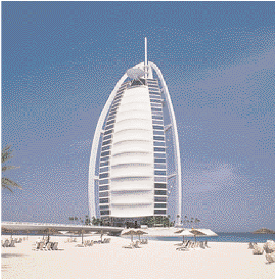
Burj Al Arab