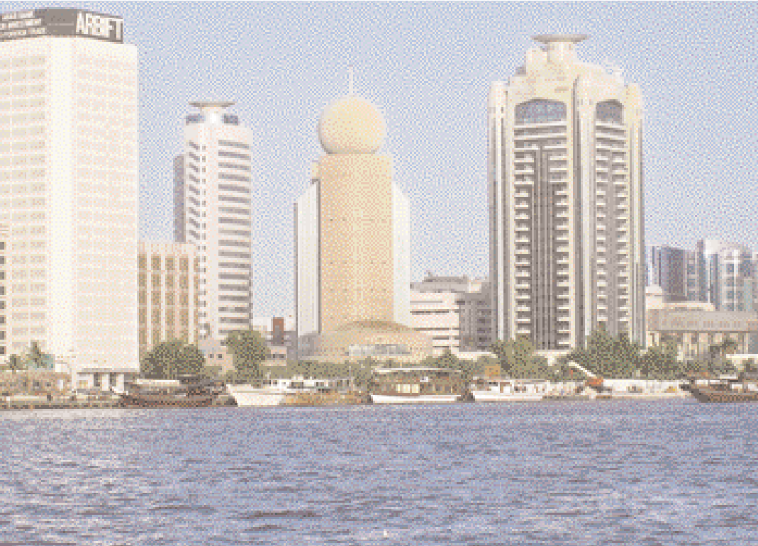
Dhow along Dubai Creek