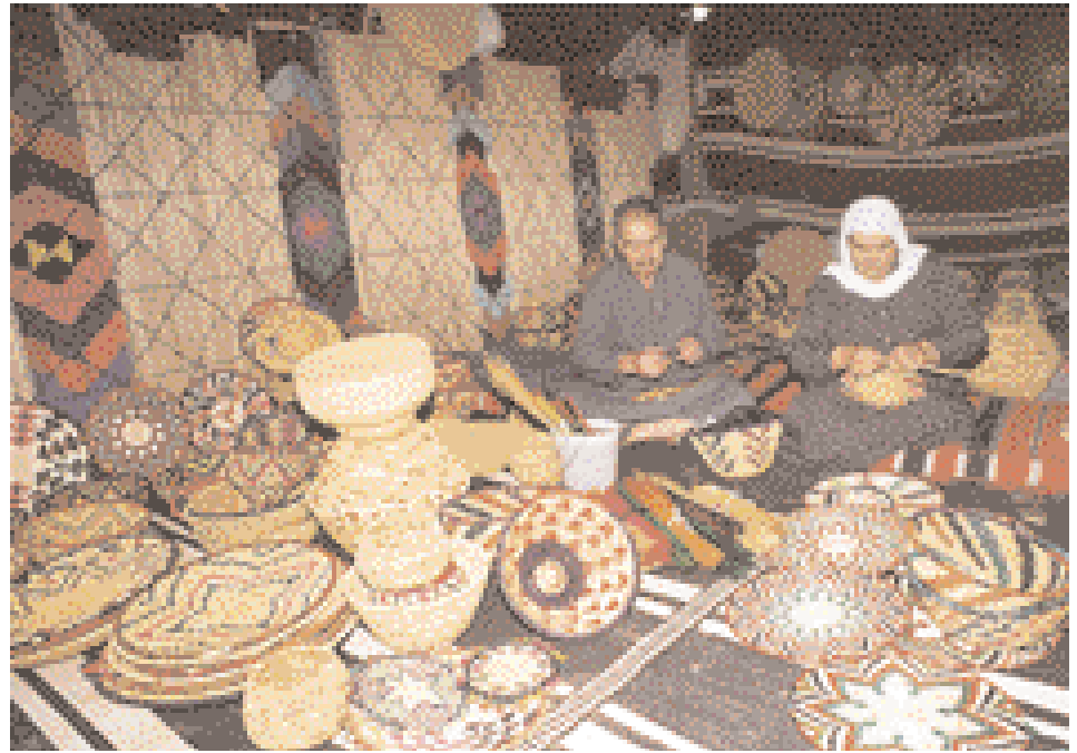
Heritage Village - Weaving Straw Baskets