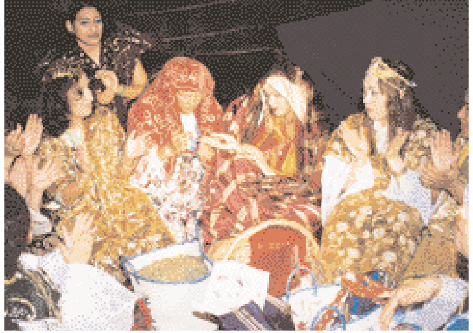
Heritage Village - Henna Ceremony

وقد وقفنا عند إحدى شرفاته، متأملين جوانب المنظر البانورامي الجميل، وكان تحتنا فضاء واسع جدا مغطى بالبلاطة الملونة ذات التصاميم الدقيقة، ووراء ذلك، وعلى جانبي الخور، يندمج القديم مع ما بعد الحداثة. وتنافست العبارات والدهوات مع البناءات المذهلة التي تناطح السحاب للحصول على الاهتمام. إنه ←