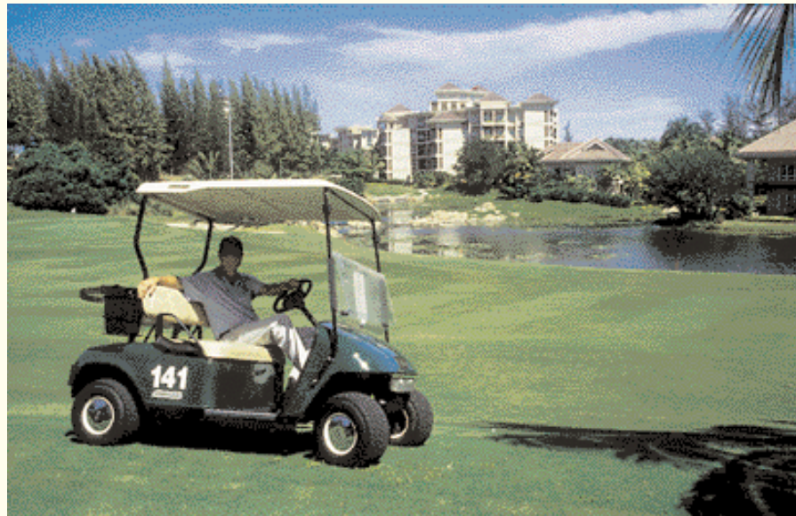
Empire Hôtel- Golf Club.