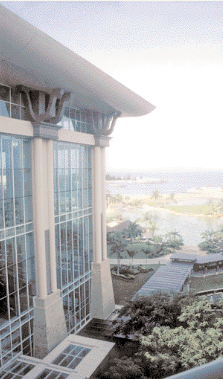
Empire Hôtel et Country Club.