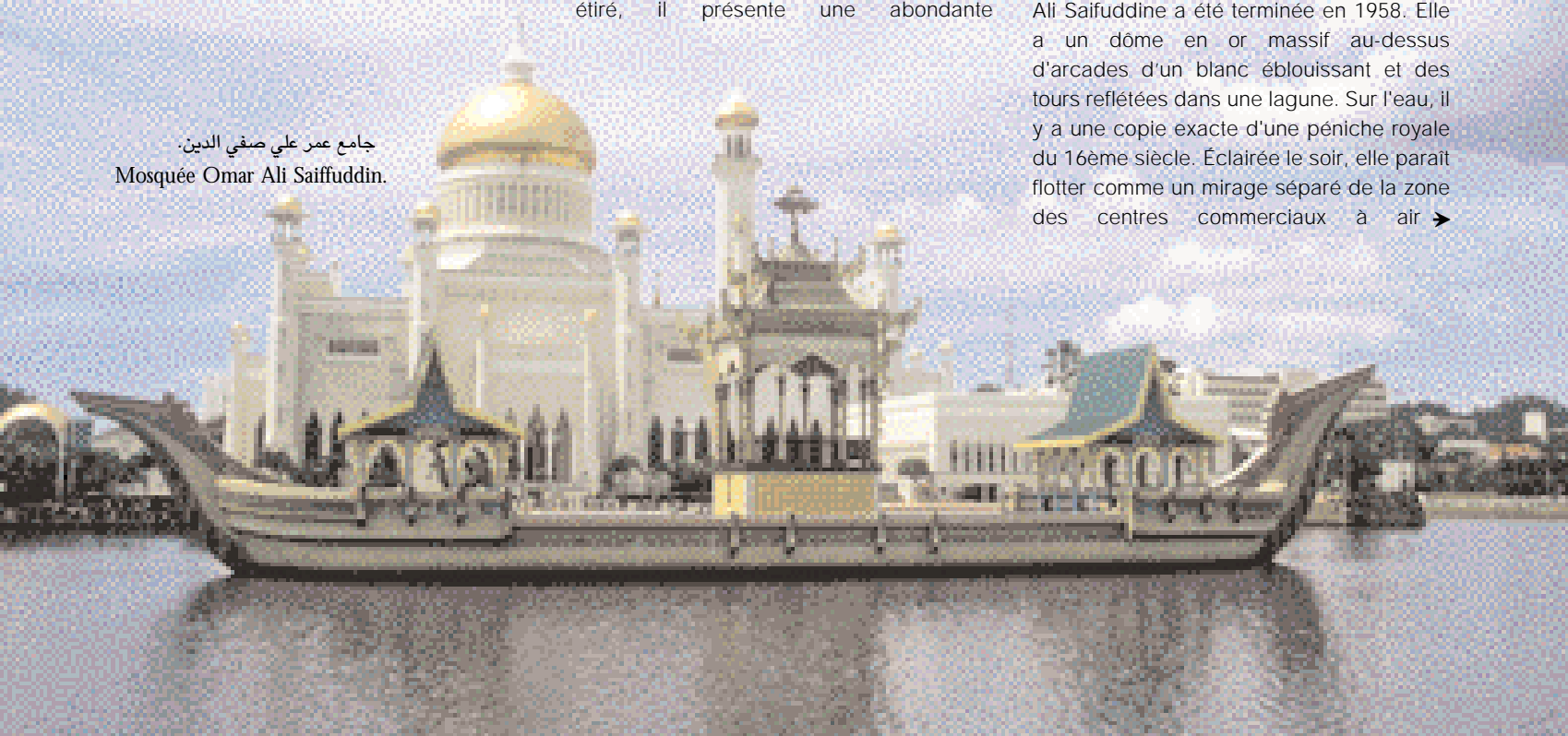
جامع عمر علي صفي الدين. Mosquée Omar Ali Saifuddin.

Partout dans la ville votre regard est attiré par des dômes d'or et des minarets de mosquées. Les deux plus grandes mosquées ont été construites par le Sultan présent et son père. Celle du Sultan Omar Ali Saifuddine a été terminée en 1958. Elle a un dôme en or massif au-dessus d'arcades d'un blanc éblouissant et des tours reflétées dans une lagune. Sur l'eau, il y a une copie exacte d'une péniche royale du 16ème siècle. Éclairée le soir, elle paraît flotter comme un mirage séparé de la zone des centres commerciaux à air ➤