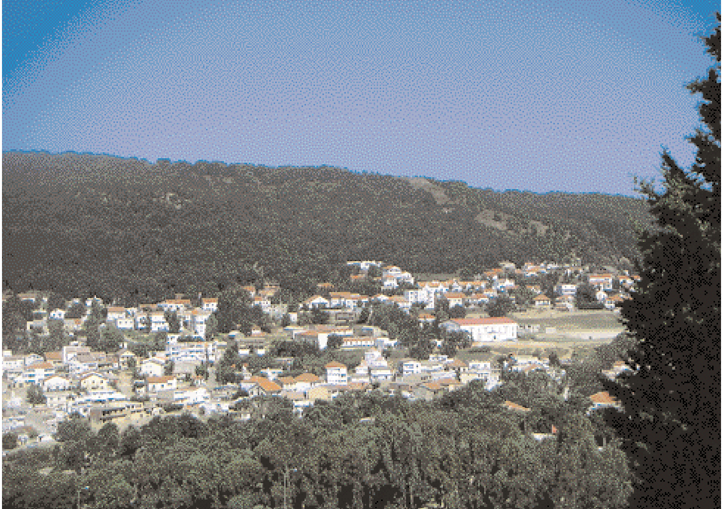
Montaña verdes de Ain Drahem