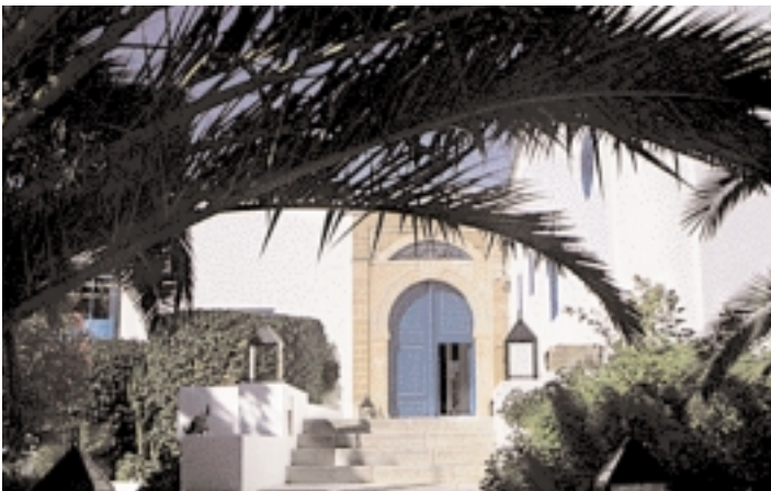
Dar Saïd - Hotel Charm en Sidi Bou Saïd.