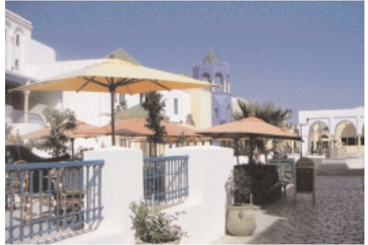
La medina de Yamine Hammamet