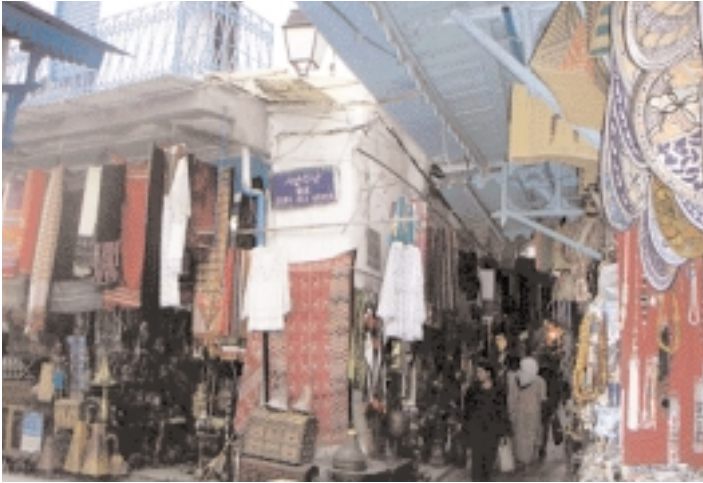
El zoco en la medina de Túnez-capital السوق في المدينة القديمة بتونس العاصمة

University of Mainz (a.alhamarneh@geo.unimainz.de).