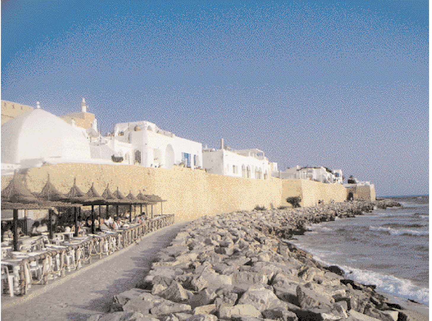
La encantadora medina de Hammamet