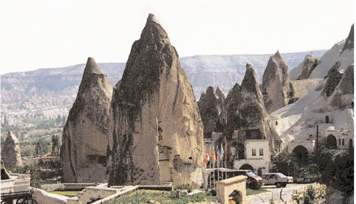
Pueblo de Goreme, entre extrañas formaciones rocosas