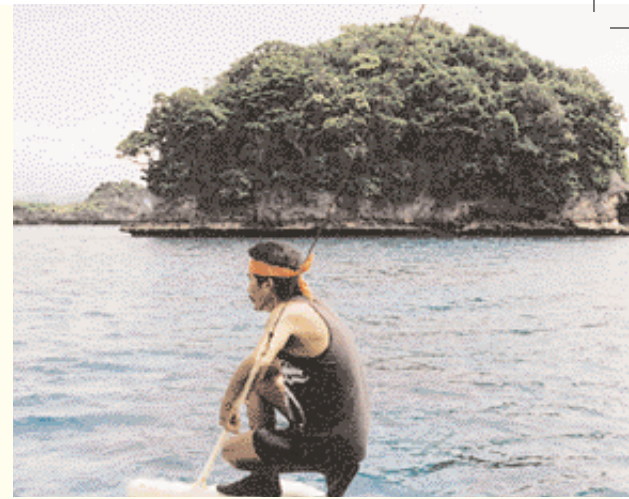
L'homme et la mer.

Les responsables du tourisme affirment que les choses sont en voie d'amélioration aux Philippines et qu'il y a une classe moyenne émergente. Si c'est le cas, celle-ci n'est pas visible. En ce qui me concerne, il y a encore un grand écart encore ceux qui possèdent