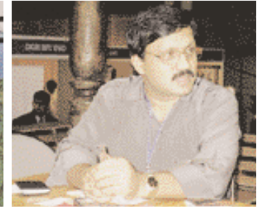
Vue générale de l'exposition. منظر عام داخل المعرض.