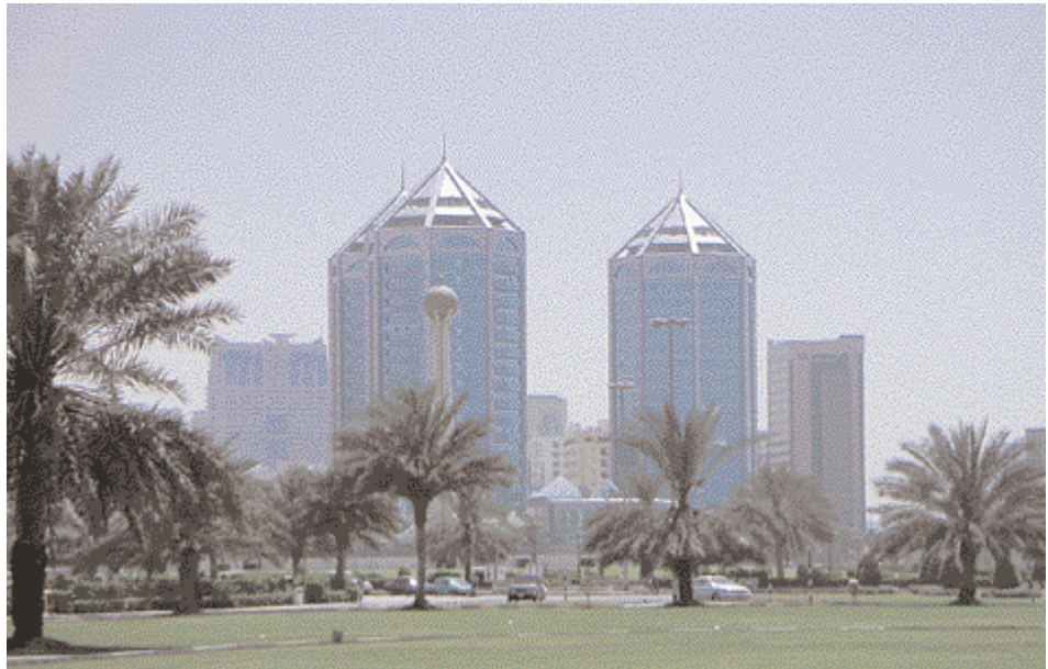
New buildings with elements of Arabic architecture.