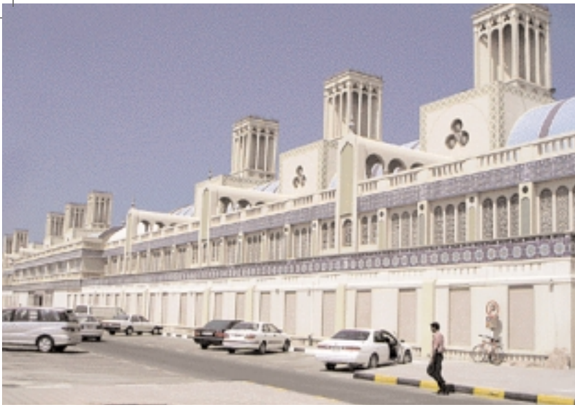
The Central Souk.